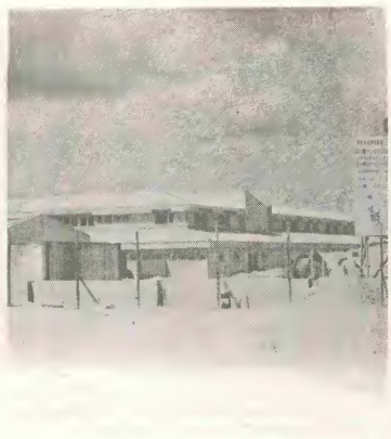
E construccion di e school hotelero ta avanzando y den curso di aña 82 por spera su apertura oficial.